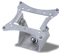
Soporte positionable [22015188]