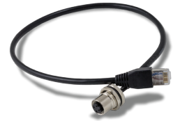
Kit de extensión, Ethernet [30139562]