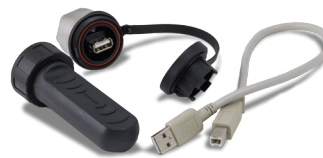
Kit de extensión, USB [301139560]