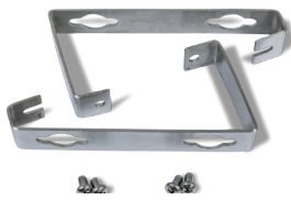
Soportes de montaje de pared [incluido con la terminal para ambientes adversos]