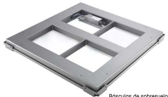
Básculas de sobresuelo de acero inoxidable

Los estándares de 3A o el European Hygienic Engineering & Design Group permiten diferentes composiciones de materiales, pero en la industria alimentaria se usan habitualmente las dos composiciones siguientes para básculas de sobresuelo.