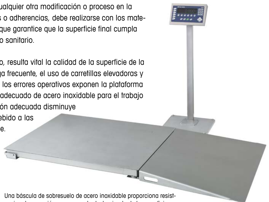
Una báscula de sobreesuelo de acero inoxidable proporciona resistencia a la corrosión y no presenta deslaminado de la superficie.

En las básculas de sobreesuelo, resulta vital la calidad de la superficie de la plataforma de pesaje. La carga frecuente, el uso de carretillas elevadoras y gatos para tarimas, así como los errores operativos exponen la plataforma a daños. La elección del tipo adecuado de acero inoxidable para el trabajo con la resistencia a la corrosión adecuada disminuye el riesgo de contaminación debido a las irregularidades de la superficie.