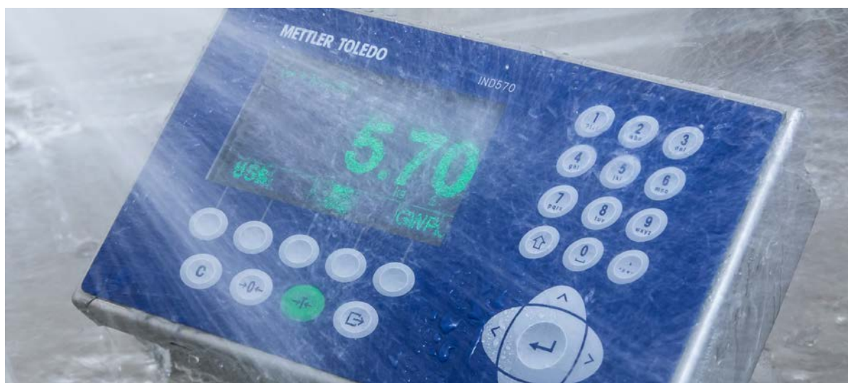
Los terminales de pesaje con protección IP69k resisten procedimientos de lavado intenso

Las superficies en contacto con el producto deben tener una rugosidad de Ra < 0,8 \mu\text{m}