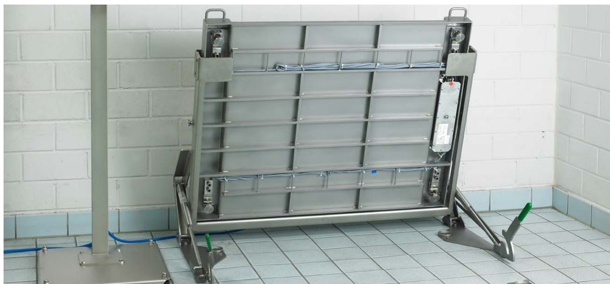
Báscula de sobresuelo con platillo elevable, instalación en el suelo

En estos casos, la plataforma de la báscula está al nivel del suelo y no es necesario realizar ningún esfuerzo para cargar las mercancías. A pesar de ello, la experiencia ha demostrado que no siempre es fácil llegar a todas las esquinas y las grietas de un foso cuando se está limpiando. Una báscula con diseño higiénico solo es eficaz cuando tiene que sanear por completo su lugar de trabajo.