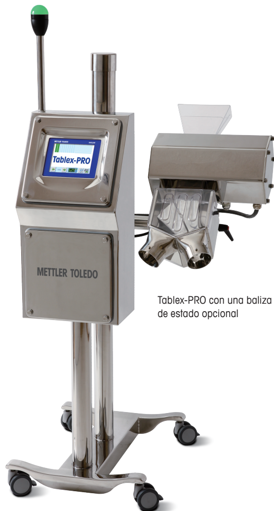
Tablex-PRO con una baliza de estado opcional